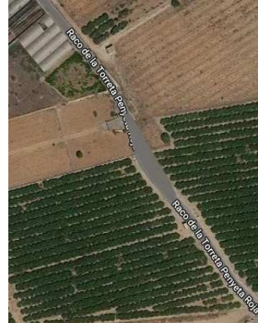
Con el ensanchamiento y apartadero

PROPOSTA 9. Indiquen que les mesures normals que s'utilitzen per a combatre la plaga de panderoles, en Racó de la Torreta són insuficients. Es necessitaria una actuació més profunda del problema. En esta època de l'any, tenen moltíssimes.