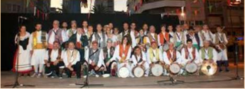
LA COLLA DE DOLÇAINERS I TABALETERS DE CASTELLÓ ENCAPÇALANT LA CAVALCADA