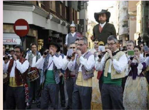
Els gegants, "Bufanúvols i a Cagueme" en la foto, precedits pels Dolçainers i Tabaleters

Una part a la qual es té un afecte especialment per als més menuts és la mitològica, davant els nostres ulls desfilarà la fantasia, el colorit, les formes i el moviment dels gegants i cabuts de la colla del Rei Barbut. Tots els personatges tenen uns noms molt característics, que estan extrets de l'obra Tombatossals, de l'escriptor castellanenc Josep Pascual Tirado.