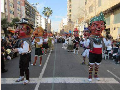
La part mitològica a càrrec de la Colla del Rei Barbut, ací podem apreciar el "Ball dels nanos"