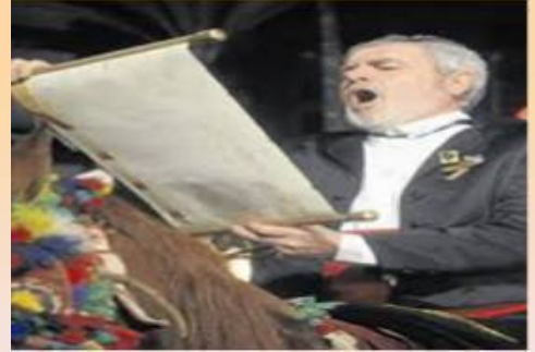
EL SEQUIER MAJOR O PREGONER