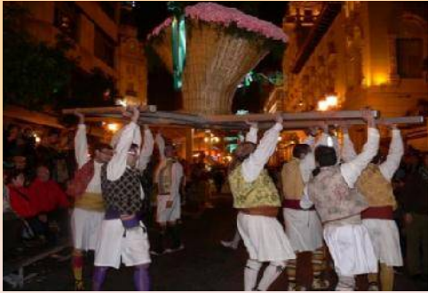
LA CISTELLA VOLTANT