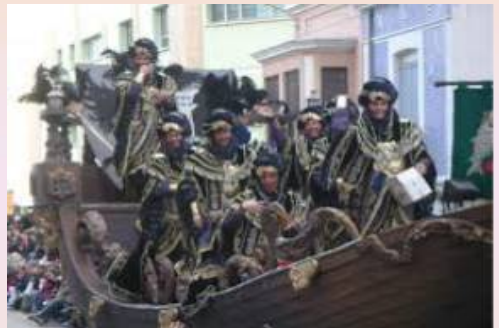
CORSARIS BERBERISC'S COL·LA "BACALAO"