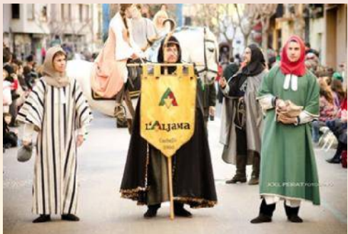
L'ALJAMA, LA REPRESENTACIÓ JUEVA DEL PREGÓ