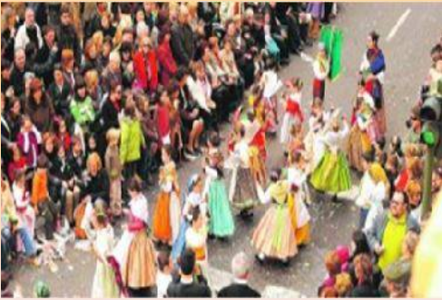
DANSES TRADICIONALS DE LES NOSTRES TERRES PER TOT ARREU DEL PREGÓ