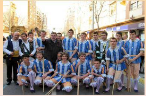
ELS TORNEROS DE MORELLA PREPARATS PER EIXIR AL PREGÓ