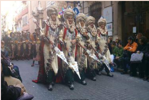
UNA FIL·LÀ DEL GRUP MOROS D'ALQUERIA

Les arrels històriques dels castellanencs és fan ressò al Pregó, acolorida desfilada de la recreació de les diferents cultures protagonistes del naixement de la ciutat i que van conviure durant molts segles entre els seus murs: cristians, musulmans i jueus, així com a els corsaris berberescs que van assotar les costes mediterrànies fins al segle XVIII.