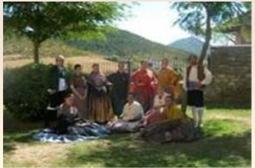
EL FOLKLORE ARAGONÉS, TANT ARRELAT HISTÒRICAMENT A LES NOSTRES TERRES