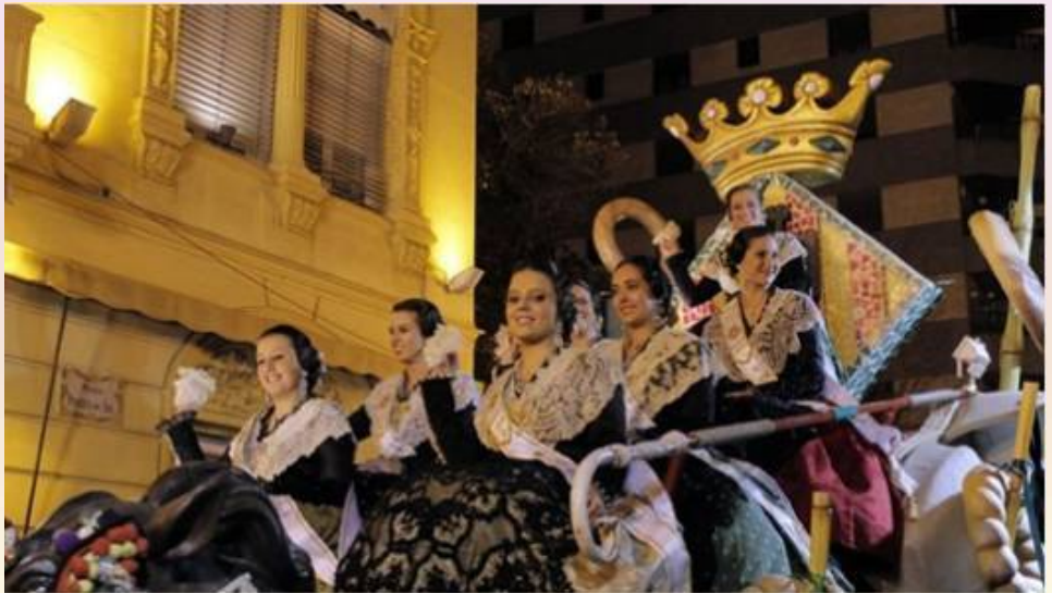
LA REGINA DE LES FESTES I LA SEUA CORT D'HONOR

El tancament del Pregó, com no podria ser d'altra manera, és aludint a la música, la Banda de Música Municipal de Castelló interpretarà el pasdoble Rotllo i Canya, peça musical que per als Castellonencs és més que un himne: sentiment de germanor, això és la nostra festa.